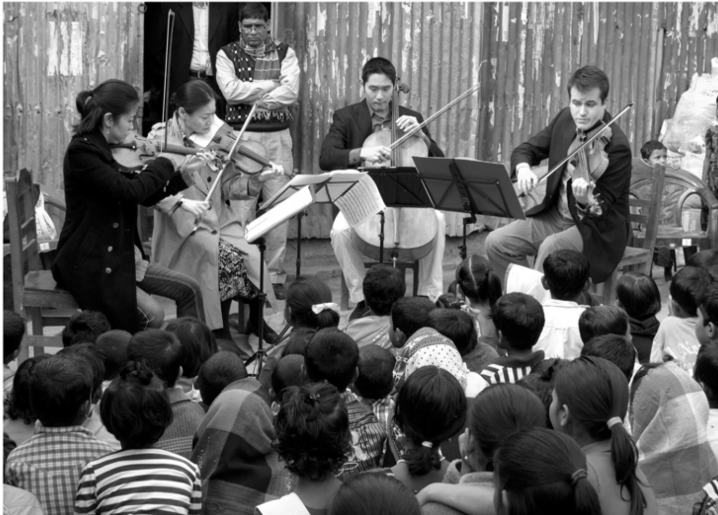
初めて見る楽器の生演奏に目も耳も釘づけの子どもたち