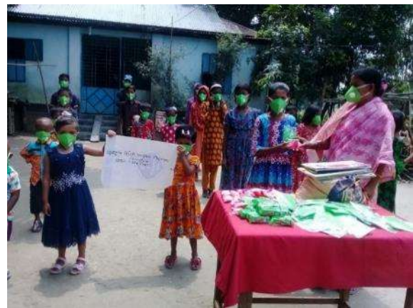
▲ダッカ・スラム地区の BDP 学校での配布