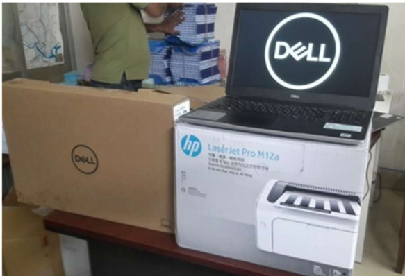
▲6 地区のBDP 事務所にPC とプリンターを設置