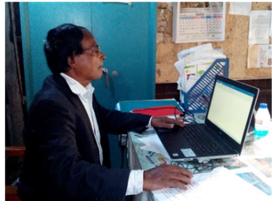
▲カティラ地区のBDP 事務局での利用