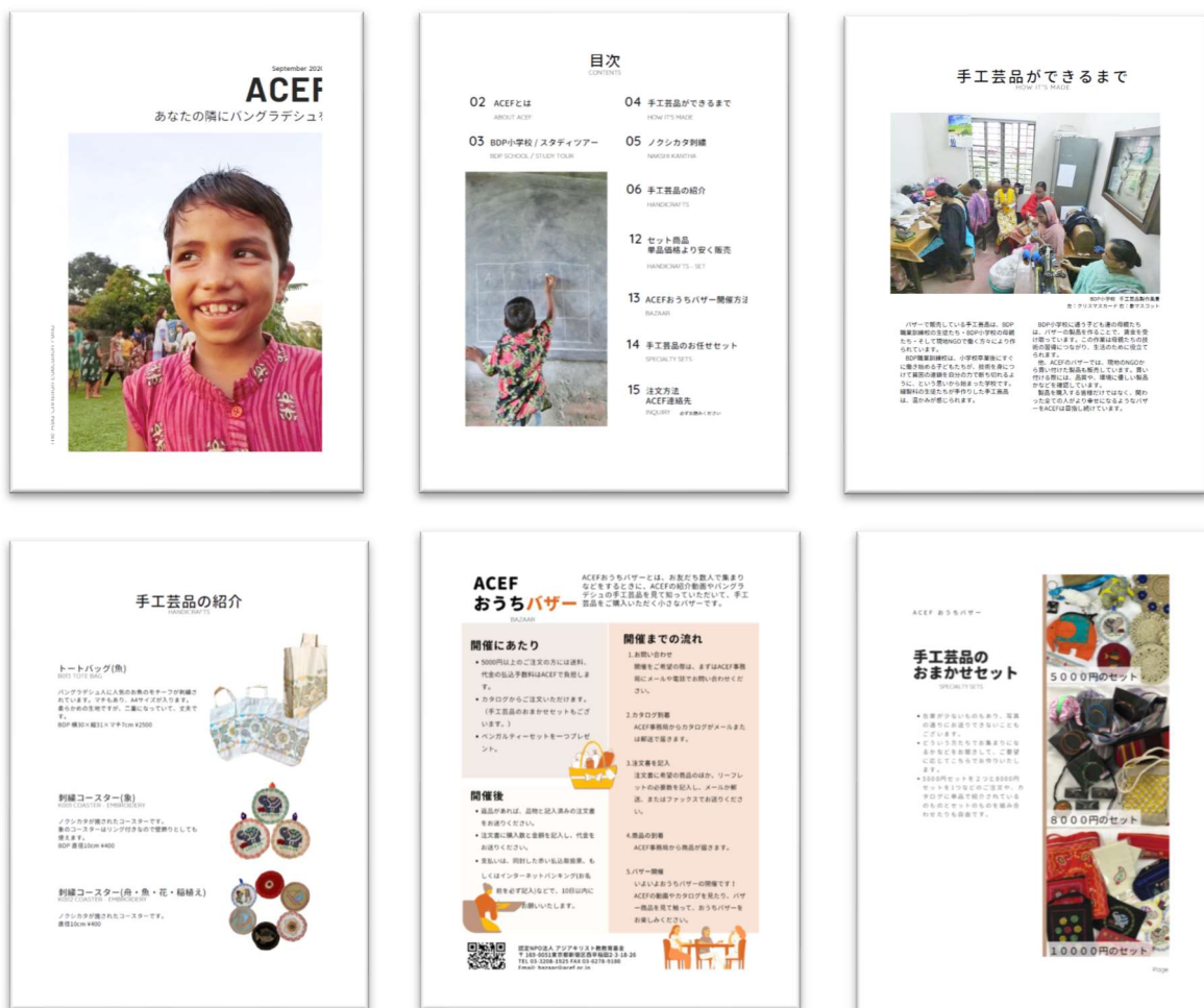
▲ 学生がデザインし作成したカタログ

認定こども園母の会、山梨英和ダグラス・プレストン・カートメルこども園 札幌桑園幼稚園、女子聖学院、東村山教会、由木キリスト教会、千歳船橋教会 東洋英和幼稚園虹の会、勝田台教会、共愛学園中学・高等学校、久我山教会 相愛幼稚園、めぐみの子幼稚園、浦和ルーテル学院、柿ノ木坂教会ベテル幼稚園 福島伊達教会、信濃村教会、友の会国際交流の会 (注文順)