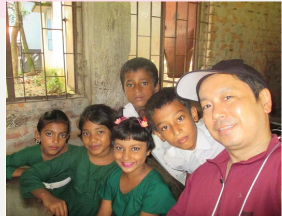
↑ 2019 Study Tour

"I first participated in ACEF's study tour in the summer of 2019. The first school we visited on that tour was the Baniabari BDP School in the Pubail District. This school is located in an area with a high population of economically disadvantaged Hindus. The children there were very friendly and helped ease our nervousness.