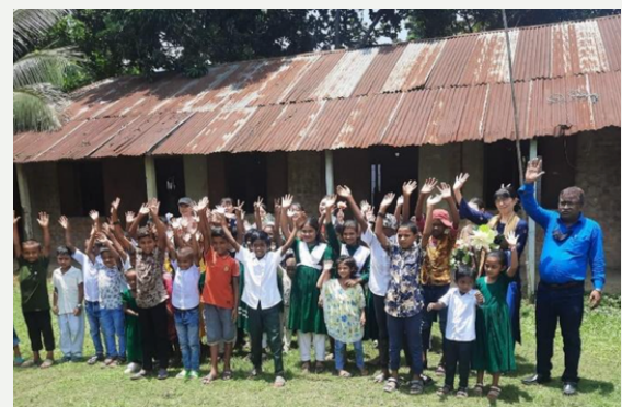
↑ 2022 Study Tour