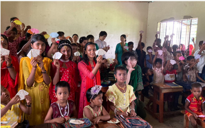
↑ 2023 Summer Bangladesh Study Tour. We made Origami together!