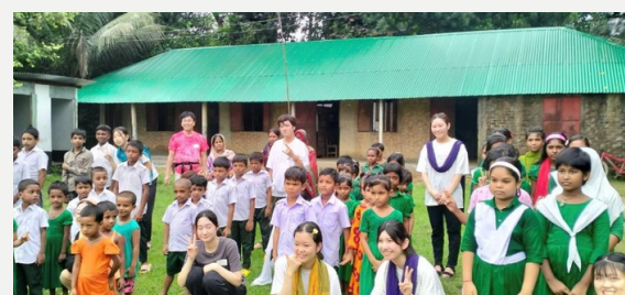
↑ 2023 Study Tour

This year, although I couldn't personally participate in the study tour, I received a group photo from the Baniabari BDP School. The roof of the school building, which had been rusty and worn out, had transformed into a clean green color. When I inquired if the roof had been repaired, I received the reply, 'Yes, we did repair Baniabari School!' This was a heartwarming moment where I felt the tangible improvement in Bangladesh's educational environment through the collaboration between ACEF and BDP."