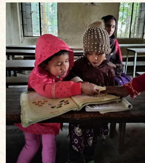
↑ January 2025 At BDP school