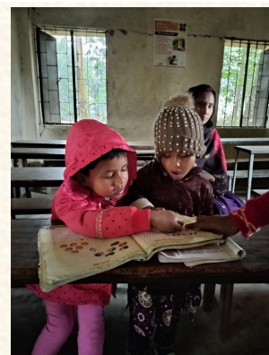
↑2025年1月 BDPスクールにて

バングラデシュの教育の様々なリアルを垣間見ることのできた、新年初日の学校訪問でした。」